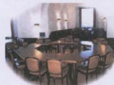
Technisch bestens ausgestatteter Schulungsraum mit Internetzugang