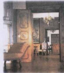
Stilvoll eingerichtete Zimmer

Im Schloss Drosendorf ist die Romantik zu Hause - genießen Sie das historische Ambiente. Ideal zum Entspannen und Kraft tanken.