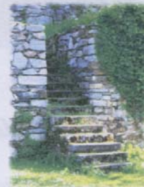
Österreichs einzige vollständig erhaltene Stadtmauer